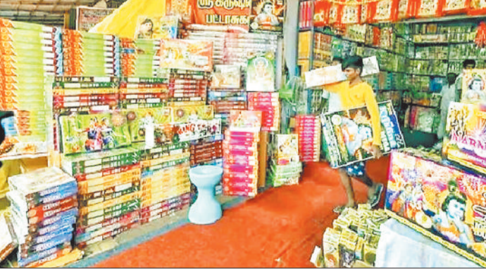
शुभकामनाएं देते हैं। यह पर्व पटाखे और दीपों की रोशनी के बिना अधूरा है। हर वर्ष की तरह इस वर्ष भी जिले में पटाखा दुकानें

मौसम की उतार चढ़ाव के बीच इस बार दीवाली मनाई गई। इसके लिए शहरी, उपनगरीय व ग्रामीण अंचल में पटाखे का बाजार भी लगाया गया था। इस दीवाली में हर बार की तरह पटाखा व्यवसायियों के यहां ग्राहकों की भीड़ देखी गई। यदि व्यवसायियों की मानें तो इस बार दीवाली पर्व पर पूरे जिले में लगभग 5 करोड़ से अधिक के पटाखे जलाए गए।