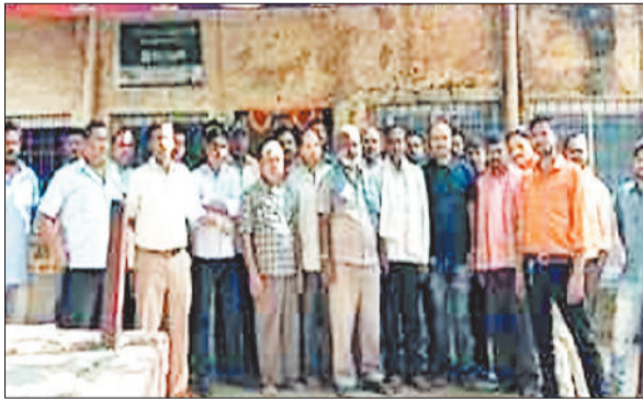
बैठक के दौरान इलेक्ट्रिक ऑटो चालक।

जिले के इलेक्ट्रिक ऑटो चालकों की रोजी-रोटी पर संकट मंडरा रहा है। ऑटो के पाटर्स की अनुपलब्धता और सब्सिडी में देरी के कारण चालकों की मुश्किलें बढ़ गई हैं। इस मुद्दे को लेकर टीपी नगर स्थित जिला ऑटो संघ कार्यालय में चालकों और पदाधिकारियों की बैठक हुई, जिसमें समस्याओं के समाधान की दिशा में कदम उठाने