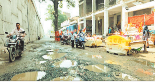
बीच 2 माह पूर्व ही पचपेड़ी में टोल प्लांजा शुरू कर टोल वसूली शुरू कर दी गई है। एनएचआई के इस मनमानी के खिलाफ विरोध के स्वर भी फूटें थे, लेकिन वो भी कुछ समय बाद उठे पड़ गए और मार्ग में टोल वसूली की जा रही है, जबकि बरपाली में एवं मड़वारांनी में पूरी तरह डामरीकृत सर्विस रोड तैयार नहीं किया जा सका है। बरपाली में अंडर ब्रिज से आगे का हिस्सा राइस मिल के कोर्ट प्रकरण की वजह से अटका है तो उसी लाइन के शेष अविवादित हिस्से में भी एनएचआई के फर्म ने सर्विस रोड का पक्कीकरण नहीं किया। बात करें मड़वारांनी की तो यहां सबसे ज्यादा दिक्कतों का सामना करना पड़ रहा है। मड़वारांनी मंदिर से लगे सर्विस रोड के निर्माण में इस कदर गुणवत्ता की अनदेखी कर

राष्ट्रीय राजमार्ग क्रमांक 149 बी कोरबा-चांपा में एनएचआई प्रबंधन की उदासीनता, ठेकेदार की लापरवाही आम जनता पर भारी पड़ रही। मड़वारांनी मंदिर से लगे सर्विस रोड तकनीकी मानकों गुणवत्ता की अनदेखी से जानलेवा बन चुकी है। अधूरे सड़क, सर्विस रोड के साथ टोल प्लांजा के जरिए टोल वसूली में मस्त एनएचआई के जिम्मेदार अफसरों, ठेकेदार की मनमानी की वजह से जर्जर सर्विस रोड गंभीर दुर्घटना को आमंत्रण दे रहा है। वहीं प्रशासन की मूकदर्शक वाली भूमिका आस्था के साथ मंदिर पहुंचने वाले लोगों के मन में शासन प्रशासन के प्रति अविश्वास की भावना उत्पन्न कर रही है।