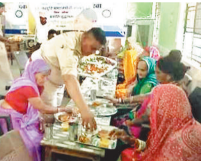
वृद्धजनों को भोजन कराते पुलिस कर्मी।

बल्कि उनके साथ बैठकर सामूहिक भोज भी किया। इस अवसर पर वृद्धजनों ने भावुक होकर पुलिस विभाग का आभार जताया और कहा कि यह दीपावली उनके लिए वर्षों बाद कुछ खास बनी है। पुलिस अधिकारियों ने बताया कि समाज के हर वर्ग को साथ लेकर चलना ही असली सेवा है और इस तरह के आयोजन से उन्हें आत्मिक संतुष्टि मिलती है। जिला पुलिस की यह पहल ना केवल मानवता का उदाहरण है, बल्कि यह समाज के अन्य वर्गों को भी प्रेरणा देती है कि त्योहारों की खुशियां केवल अपनों तक सीमित नहीं होनी चाहिए बल्कि उन तक भी पहुंचनी चाहिए जो अकेलेपन और उपेक्षा का जीवन जी रहे हैं।