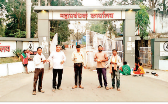
कोरबा महाप्रबंधक कार्यालय के सामने दीप प्रज्वलित कर विरोध प्रदर्शन करते भूविस्थापित एवं किसान सभा के पदाधिकारी।

एसईसीएल गेवरा और कुसमुंडा क्षेत्र के भूविस्थापितों ने दीवाली के समय भी एसईसीएल गेवरा क्षेत्र के भिलाई बाजार के पास और कुसमुंडा मुख्यालय पर धरना जारी रखा है। वे अधिग्रहित भूमि के एवज में खोले रोजगार, प्रत्येक छोटे खातेदार को रोजगार देने और प्रत्येक विस्थापितों को बसावट की मांग कर रहे हैं। जिन लोगों ने अपनी जमीन देकर देश-दुनिया को रोजगार देने का काम किया और जिले को ऊर्जाधानी के रूप में पहचाना है, आज वहीं परिवार रोजगार के लिए भटक रहे हैं। इसलिए भूविस्थापितों ने एसईसीएल के मुख्यालयों पर दीप जलाकर विरोध प्रकट किया और एसईसीएल के दमन और तानाशाही के खिलाफ 23 अक्टूबर को गेवरा खदान बंद करने का ऐलान किया है। इस दीवाली पर भूविस्थापितों ने