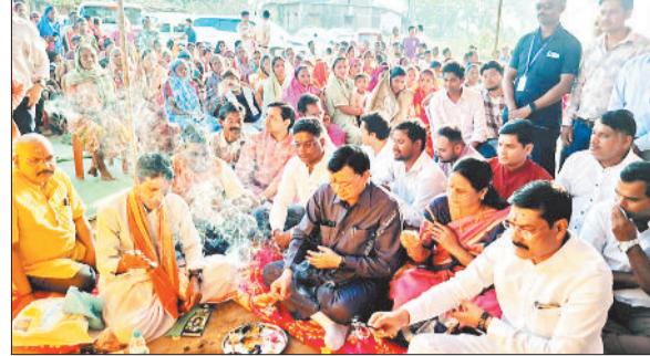
भूमिपूजन के दौरान उद्योग मंत्री, महापौर एवं अन्य।