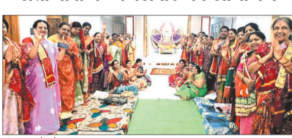
मंगलपाठ के दौरान श्रद्धालु।