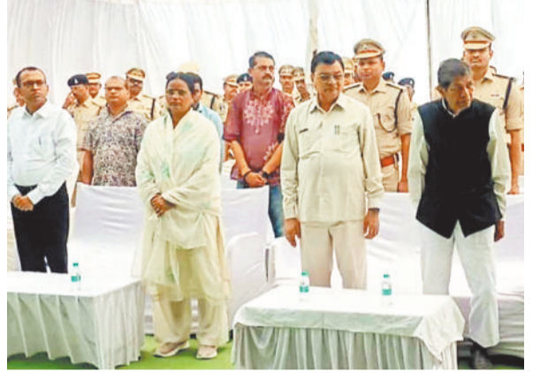
शहीद जवानों को श्रद्धांजलि देते उद्योग मंत्री, पूर्व गृहमंत्री, कलेक्टर, महापौर, एएसपी व अन्य।