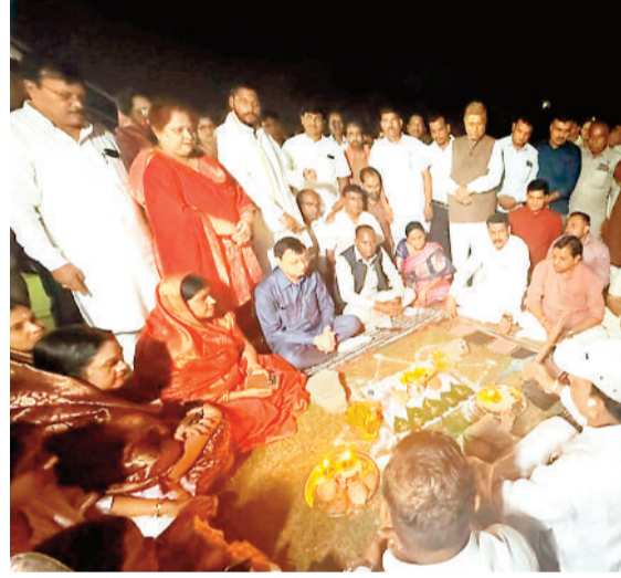
भूमिपूजन करते उद्योग मंत्री।

टीपी नगर स्थित सतनाम प्रांगण में विधायक निधि से 64 लाख रुपये की लागत से भव्य व विशाल डोम का निर्माण कराया जाएगा। मंगलवार को आयोजित कार्यक्रम के दौरान प्रदेश के उद्योग, वाणिज्य, श्रम, आबकारी व सार्वजनिक उपक्रम