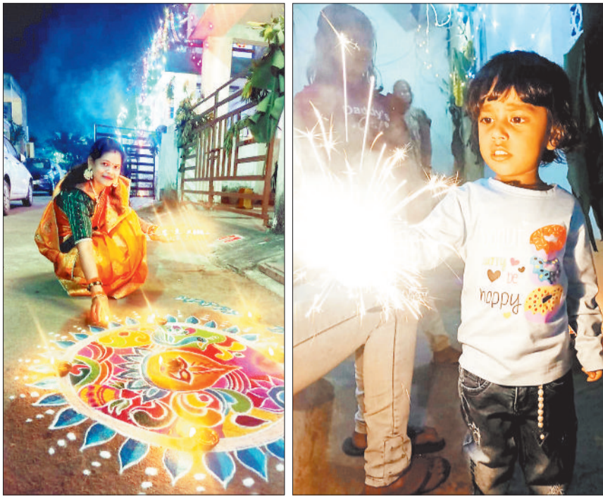
दीपावली पर दीप प्रज्वलित करती महिला।