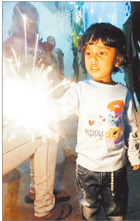
फूलझड़ी जलाती बच्ची।