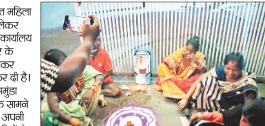
एसईसीएल कुसमुंडा खदान से प्रभावित महिला भूविस्थापितों ने रोजगार की मांग को लेकर दीपावली पर्व से कुसमुंडा महाप्रबंधक कार्यालय के मुख्य द्वार पर प्रबंधन द्वारा रोजगार के खिलाफ किए गए वादाखिलाफी को लेकर अनिश्चितकालीन भूख हड़ताल शुरू कर दी है।