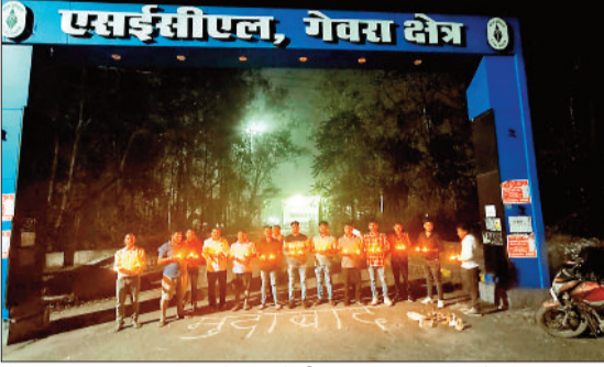
गेवरा महाप्रबंधक कार्यालय के सामने दीप प्रज्वलित कर विरोध प्रदर्शन करते भूविस्थापित एवं किसान सभा के पदाधिकारी।

एसईसीएल गेवरा और कुसमुंडा क्षेत्र के भूविस्थापितों ने महाप्रबंधक कार्यालयों के सामने दीप जलाकर अनोखे तरीके से अपना विरोध प्रदर्शन जताया। दीपावली पर्व पर भी भूविस्थापितों द्वारा अपनी मांगों को लेकर गेवरा क्षेत्र के भिलाई बाजार और कुसमुंडा महाप्रबंधक कार्यालय के सामने धरना प्रदर्शन जारी रखा गया है। भूविस्थापितों ने गुरुवार को गेवरा खदान बंद आंदोलन की चेतावनी दी है।